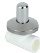
PP-R Kısa Kromlu Vana