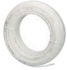
PE-RT Düz Boru